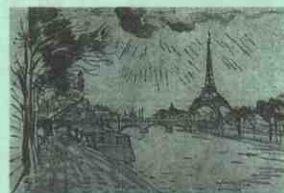
藤田嗣治画「旅愁」新聞連載の挿画