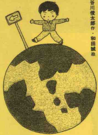
谷川俊太郎作・和田誠絵