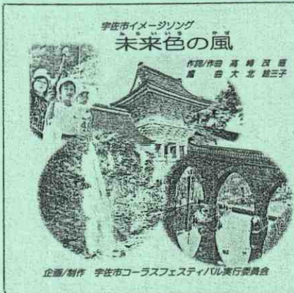
CD「未来色の風」(ジャケット)

二部合唱や三部合唱用にも編曲して、多彩な表現もできるように発展させていけたらと思っています。作成したCDは現在、図書館など、一部の公共施設に寄贈しはじめたばかりですが、いずれ各学校にもさしあげて、校歌とあわせて練習してもらえたら、こんなにうれしいことはありません。合唱コンクールや文化祭などでもとりあげてもらって、みんなで大ホールで合唱できる日がくることを夢見ています。