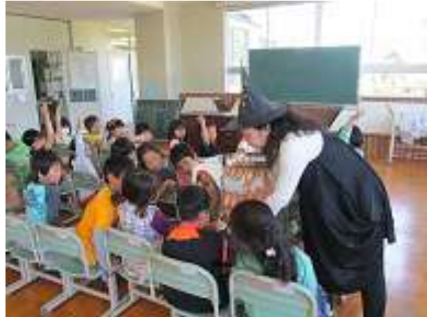
（長洲小学校で・5月21日）

今年も、新一年生への図書館利用案内を実施しております。6月末まで予定がつかっていますが、6月24日と30日に空きがあります。ご予約はお早めに。