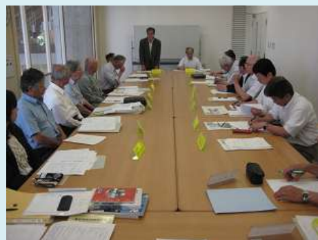
編集会議 (執筆者会議) のようす