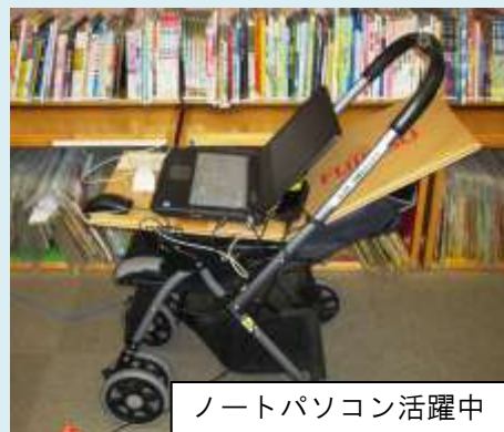
ノートパソコン活躍中

臨時休館期間中、皆様にはご不便をおかけしますが、ご理解とご協力をお願いいたします。