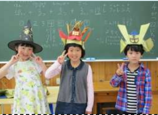
こどもの読書週間直前に訪問した津房小で

4月～6月は、新一年生の図書館 利用案内に出向いています。 市内すべての小学校が対象です。 ご依頼お待ちしております。