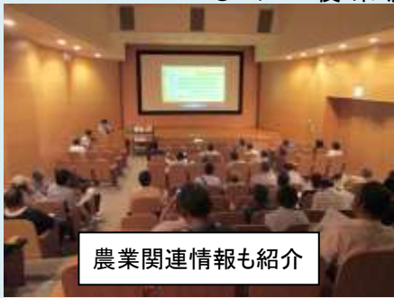
農業関連情報も紹介

9月27日、図書館視聴覚ホールで農政課の認定農業者研修を行いました。図書館と農業系出版社の農文協が協力して、DVDの上映と、家庭菜園などに役立つ情報を紹介しました。認定農業者の参加は45名でしたが、「今度借りに来たい」「役に立つ」とのことでした。