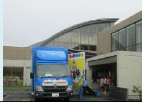
雨のため、キャラバンカーは玄関前に駐車