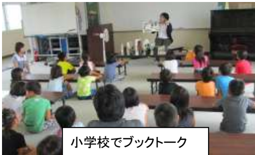
小学校でブックトーク