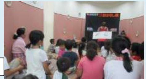
おはなし会の様子