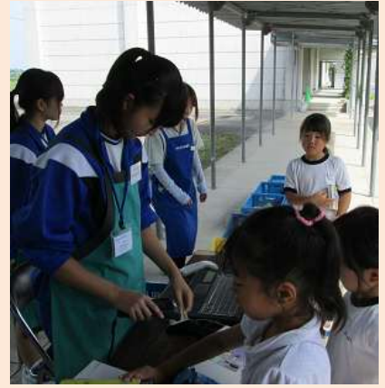
「ほんの森号」で小学校へ

おどおどしていたが、司書の方が丁寧に教えてくださって、次第に仕事もスムーズにこなせるようになっていった。書架整理や排架は結構大変で、すごく疲れた。でも、2日目には普段体験できない「ほんの森号」にも乗ることができ、楽しかった。そして、どのしごとであってもやっぱりあいさつは大切なんだと改めて思った。大きな声でのあいさつはできなかったが、気持ちがあればいいんだなと思ったし、あいさつだけでなく多くの人も交流ができ、充実した2日間だったと思う。