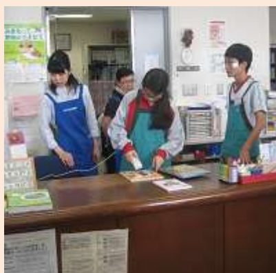
安心院分館でカウンター体験