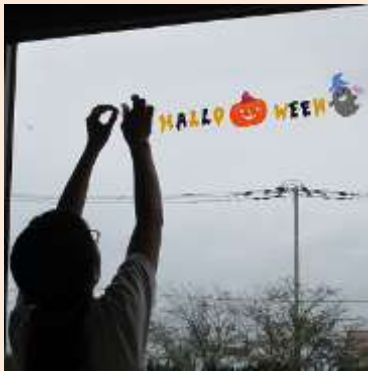
ガラスにハロウインの飾りつけ

将来何で働くかを決める参考になった。とてもやりがいがあった。「ほんの森号」はとてもたのしかった。閉架書庫の整理はちょっとしたきょう心があった。