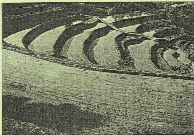
初夏 (院内) / 佐藤安男