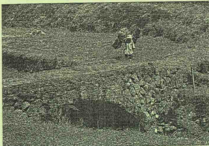
春の訪れ (院内) / 石川淑子