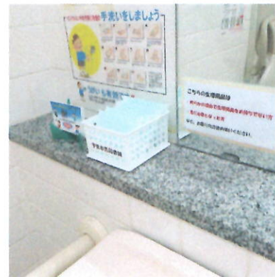
トイレに生理用品常備

コロナ禍による「生理の貧困」が世界的な問題になり、日本でも生理用品の無償提供が広がっています。宇佐市では9月議会で複数の議員に取りあげられたことなどから、このたび市庁舎、支所、市民図書館の女子トイレと多目的トイレに配置することになりました。小中学校でもトイレに設置する準備が進められています。