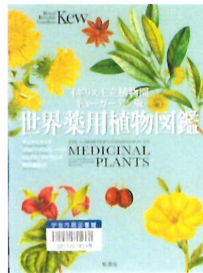
「世界薬用植物図鑑」 イギリス王立植物園キューガーデン版(原書房・2020年)

伝統医療で用いられている植物の知識をガーデナーの皆さんにお伝えすることを目的として、薬用植物270種の伝統的利用と近年の科学的評価、使用禁止の例も付け加えて紹介。ボタニカルアートの図版が豊富にあり、美しい。 また、カミツレのクリーム、ローズヒップのシロップなど、24種の伝統的なレシピも掲載しているが、アレルギーを起こす方もいるので、自己判断をしないようにと注意喚起もある。